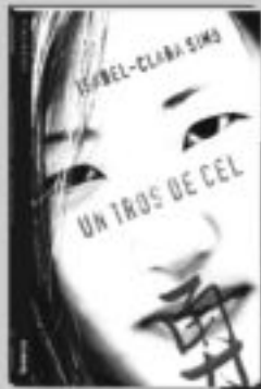
Un tros de cel Isabel-Clara Simó

propostes i es debaten, i del debat naix la llum. Les circumstàncies del valencianisme, sempre precàries, no permeteren que aquest debat prenguera cos en el seu moment, i després se l'erigí en el text canònic d'un moviment resistencial. Nosaltres els valencians ocupa encara avui un lloc massa isolat dins de les temptatives que hem fet els valencians d'explicar-nos a nosaltres mateixos. El primer a patir-ho en va ser l'autor, que era un gran polemista i es va quedar amb les ganes d'exercir-ne. Cal dir que és una llàstima, precisament perquè parlem d'un llibre intel·ligent i provocador, ple de virtuts potencialment fructíferes, que volia estimular un gran diàleg. I el va estimular, però en una escala i amb unes repercussions menors de les que mereixia. Potser per això, al cap de 50 anys, Nosaltres els valencians , en el que té de proposta i en el que té de repte, encara és un llibre que val la pena llegir i discutir. No és un monument, sinó una aposta, i es manté viu.