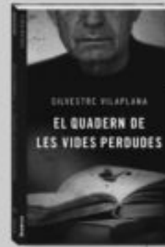
El quadern de les vides perdudes Silvestre Vilaplana